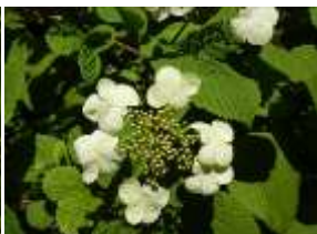
ケナシヤブデマリ