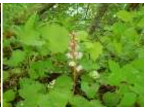
ベニバナイチヤクソウ

裏磐梯ビジターセンター 〒969-2701 福島県耶麻郡北塩原村大字松原字剣ヶ峰1093-697 【電話】0241-32-2850 【FAX】0241-32-2851 【開館時間】9:00～17:00（4～12月） 【休館日】火曜日・年末年始