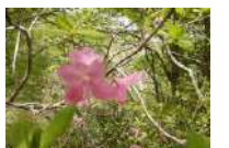
ムラサキヤシオツツジ