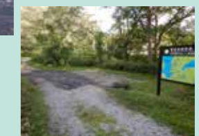
◀南側入り口 (駐車場)

この探勝路の見どころといえばなんとと言っても湖越しにみる磐梯山です。明治の噴火でできた最大の湖「松原湖」と磐梯山の爆裂噴火口をセットで望める、裏磐梯らしいスポットになります。