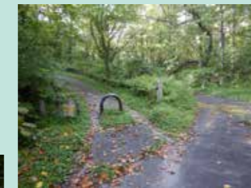
▶北側入り口 (駐車場はありません)