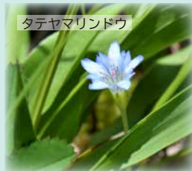
タテヤマリンドウ