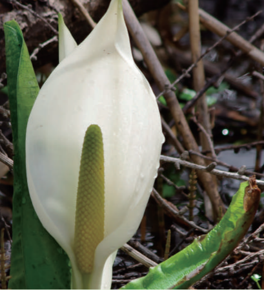
※尾瀬の春(ミズバショウの花期)は5月下旬から6月上旬頃

童謡『夏の思い出』からか初夏のイメージを持たれるミズバショウですが、これは童謡で歌われる尾瀬での話※。尾瀬よりも標高が低い裏磐梯では、4月～5月上旬頃が見頃です。