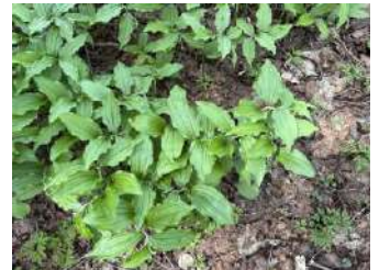
ホウチャクソウの葉