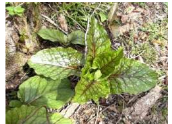
オオウバユリの葉