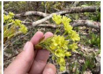
カエデの一種の花