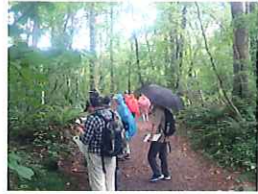
▲植物や探勝路の状況などを記録し案内に役立ちます

裏磐梯地区には14の探勝路があります(通行止め除く)。そのうち、ハイカーが多く訪れる五色沼自然探勝路や、環境省が木道等を整備しているレンゲ沼探勝路などを中心に、巡視を実施しています。巡視では、ゴミ拾いや看板等の確認、植物情報の収集等を行っています。