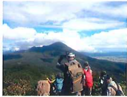
▲猫魔やまびこ探勝路より磐梯山を望む