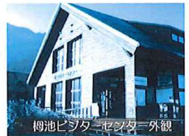
柵池ビジターセンター外観

柵池から上がる登山道は初心者の方でもチャレンジしやすいコースになっていて、幅広い客層に喜ばれています。