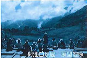
柵池自然園 展望湿原

柵池自然園は白馬乗鞍岳の東南山腹に位置し、第一種特別地域として、中部山岳国立公園の一角を占めています。