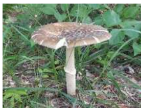
テングダケのなかま