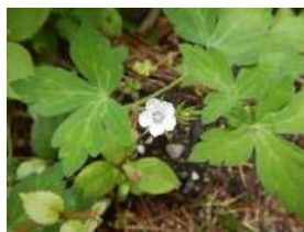
ゲンシノショウウ