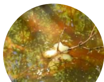
クロサンショウウオの卵塊