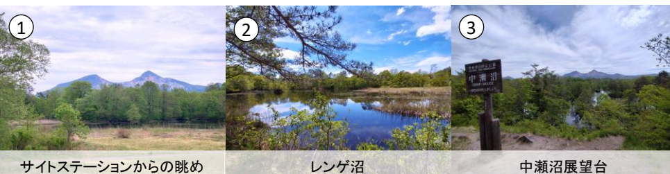
① サイトステーションからの眺め