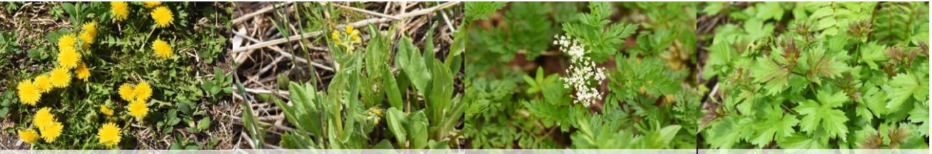
セイヨウタンポポ