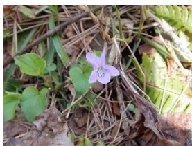
オオタチツボスミレ