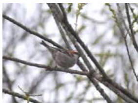
ニューナイスズメ