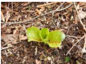
オオウバユリの葉