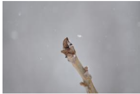
オニグルミの冬芽