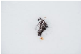
ツルアジサイの花のあと