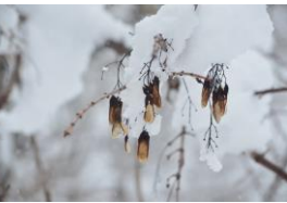
カエデの仲間の種子