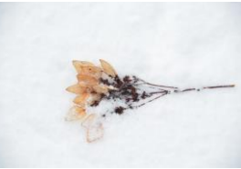
イワガラミの花のあと