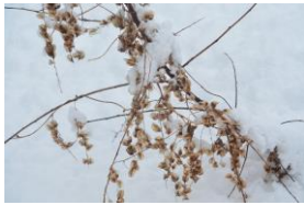
オニドコロの種子