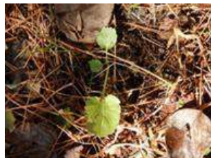
オオハンゴンソウの新芽