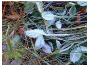
朝の冷え込みでついた霜