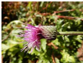
ノアザミ（季節外れの開花）