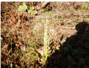
フユノハナワラビ（胞子が飛ぶ）