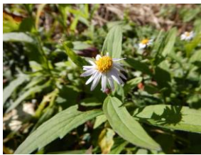
ノコンギク（満開過ぎる）