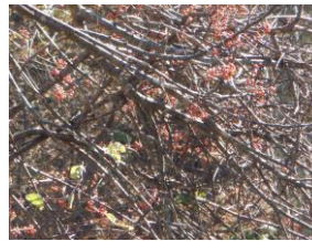
ツルウメモドキ（実）