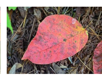
ツタウルシ(触ると危険)