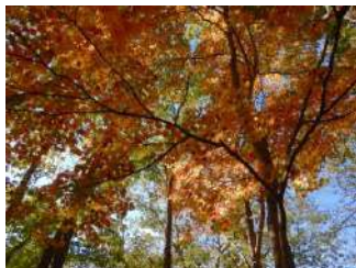
部分的に紅葉がみられました