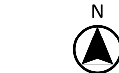
雄国沼登山口 （標高 875 m）