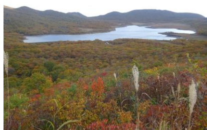
雄国山手前からの雄国沼