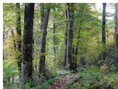
ブナ林の中の探勝路