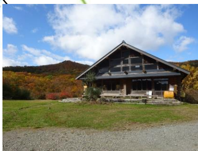
雄国沼休憩舎 （1090 m）