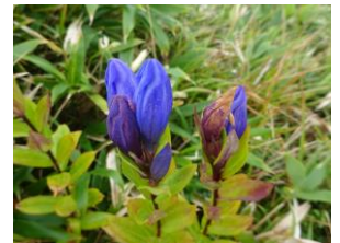
エゾオヤマリンドウ