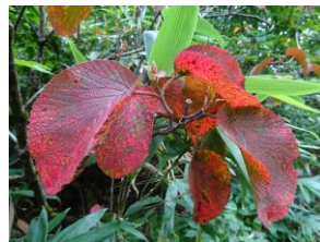
色づいたオオカメノキ