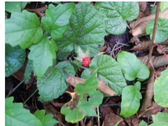
コバノフユイチゴ