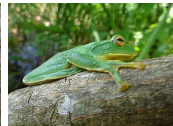
シュレーゲルアオガエル