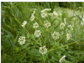
ドクゼリでしょうか？