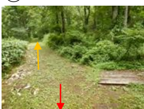
中瀬沼探勝路 桧原湖畔探勝路へ 向かう道 （現在歩行者通行止め）