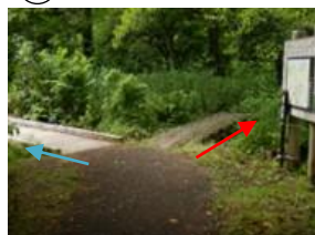
レンゲ沼探勝路 中瀬沼探勝路