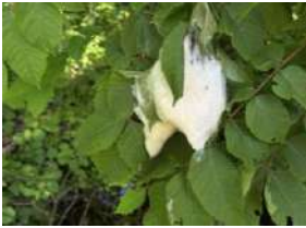
モリアオガエルの泡巣