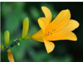
ゼンテイカ(ニッコウキスゲ)