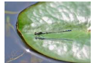
イトトンボのなかま