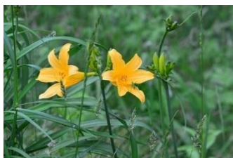
ゼンテイカ(ニッコウキスゲ) 〔裏磐梯物産館の裏〕