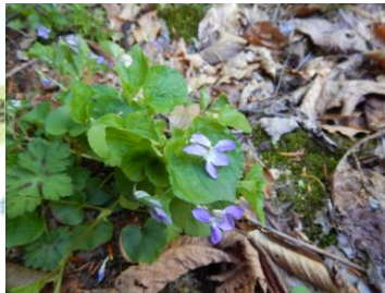
オオタチツボスミレ