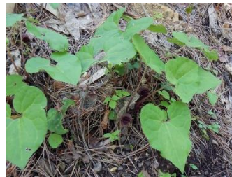
トウゴクサイシン