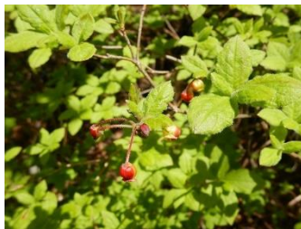
コヨウラクツツジ