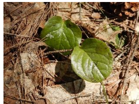
ベニバナイチヤクソウの葉