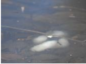
サンショウウオの卵塊