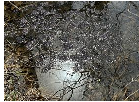
ヤマアカガエルの卵塊？