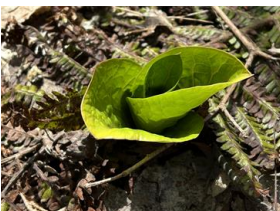
オオウバユリの葉