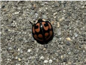
カメノコテントウ