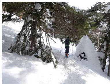
針葉樹林の中のトレース