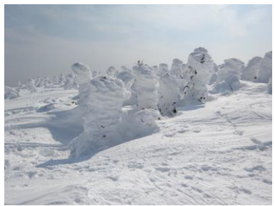
西吾妻山頂付近の樹氷