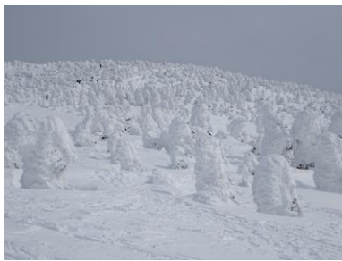
西吾妻山頂付近の樹氷