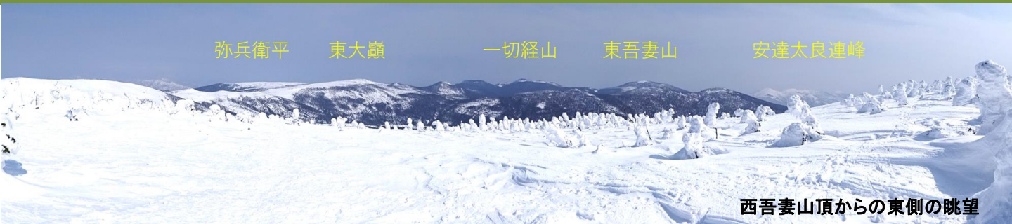
西吾妻山頂からの東側の眺望