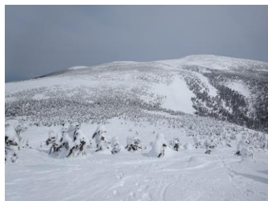
西大巔からの西吾妻山