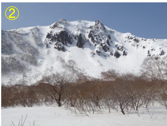
沼ノ平からの磐梯山東壁