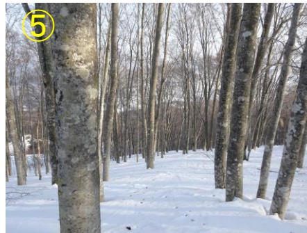
国体コース周辺のブナ林