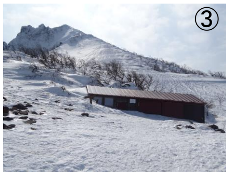
弘法清水からの磐梯山