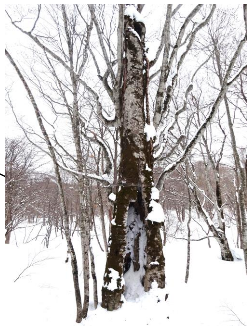
大きな洞のあるブナの老木