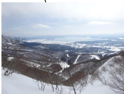
山頂からの猪苗代湖