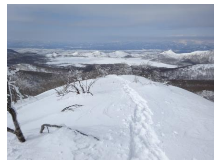
山頂付近からの雄国沼