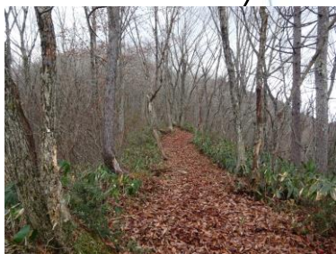
明るく平坦な尾根上の探勝路