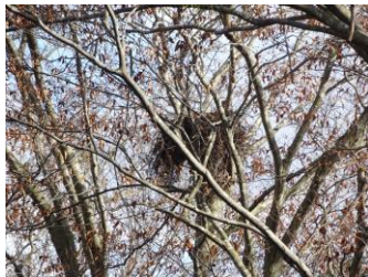
ブナにつくられたクマ棚