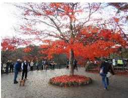
植栽のイロハモミジ