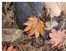
コハウチワカエデ