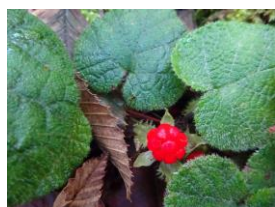
コバノフユイチゴ