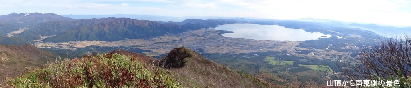
山頂から南東側の景色

磐梯山（裏磐梯登山口） 【難易度】★★★（上級） 片道約 5.4 km（約 3 時間 30 分）