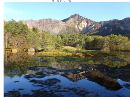
銅沼（あかぬま）からの櫛ヶ峰と火口壁東側