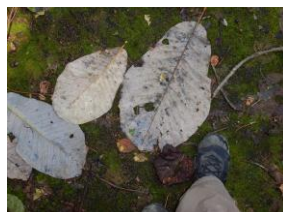
ホオノキの落ち葉と実