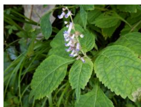
カメバヒキオコシ