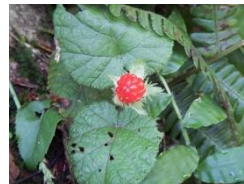
コバノフユイチゴ