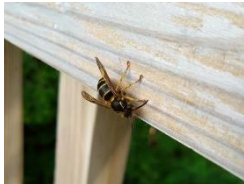
スズメバチ科の仲間