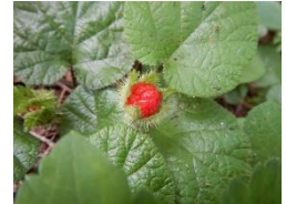
コパノフユイチゴ