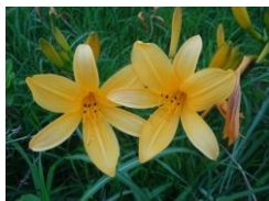
ニッコウキスゲ (ゼンテイカ)