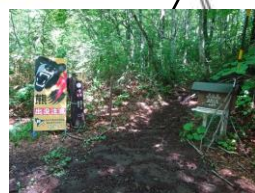
八方台 (標高 1194 m)