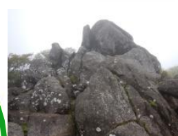
猫石 (1335 m)