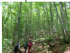
ブナ林の中の探勝路