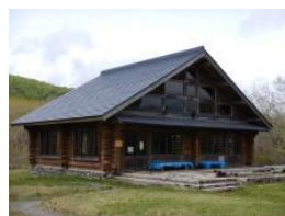
雄国休憩舎 (1090 m)