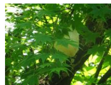
モリアオガエルの卵塊