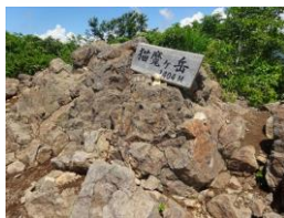
猫魔ヶ岳山頂 (1404 m)