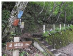
雄国沼登山口 (標高 875 m)