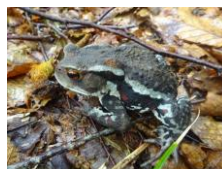
アズマヒキカエル