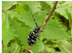
ゴマダラカミキリ