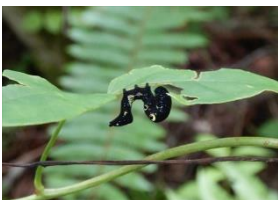
アケビコノハ(幼虫)