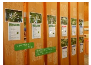
新しい展示「くらべてわかる白い花（樹木の装飾花）」もご覧ください！