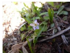
オオタチツボスミレ