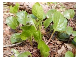
ベニバナイチヤクソウ