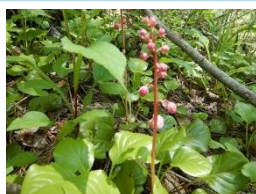
ベニバナイチヤクソウ