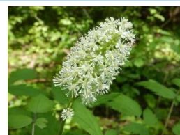
ルイヨウショウマ