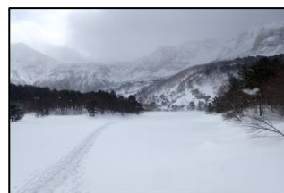
結氷・積雪した 銅沼と磐梯山