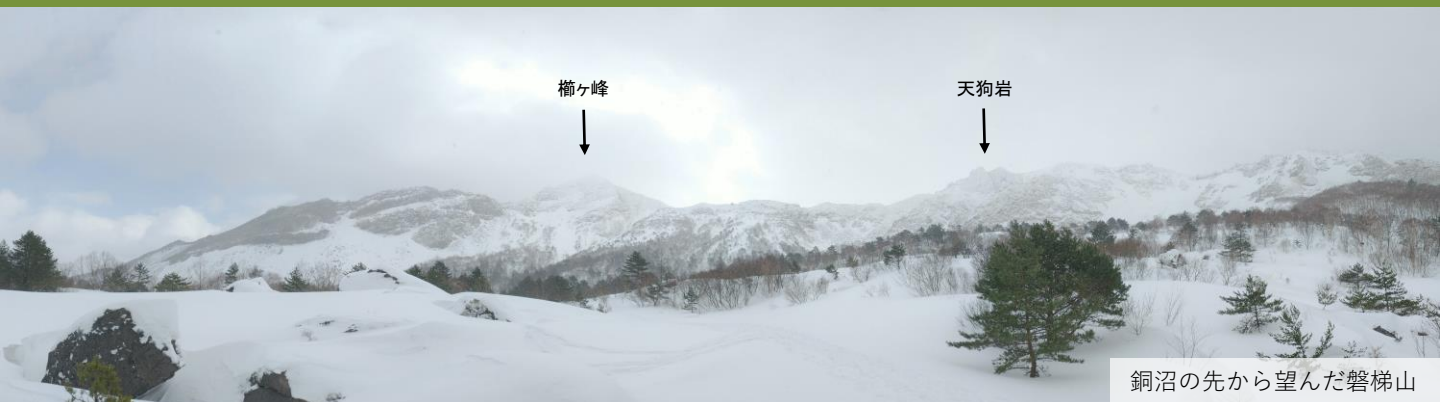
銅沼の先から望んだ磐梯山