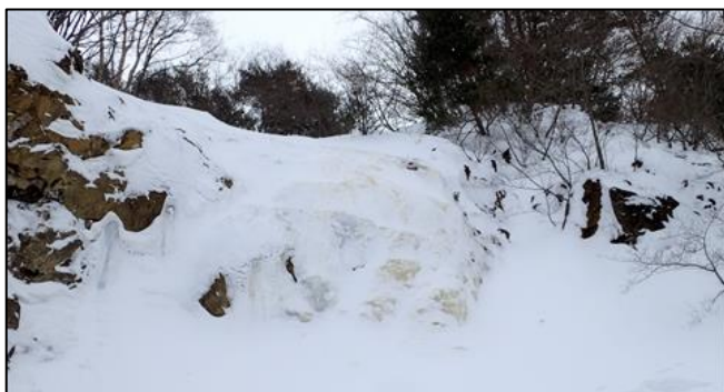
イエローフォール