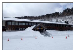
裏磐梯スキー場 スキーセンター