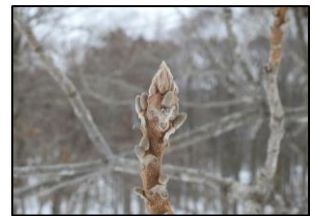
オニグルミの冬芽

裏磐梯ビジターセンター 〒969-2701 福島県耶麻郡北塩原村大字桧原字剣ヶ峯1093-697 【電話】0241-32-2850 【FAX】0241-32-2851 【入館料】無料 【開館時間】9:00～17:00（4～11月）/9:00～16:00（12～3月） 【休館日】火曜日（年末年始・GW・夏休み（海の日～8/31）は無休）