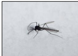
ユスリカ科の一種