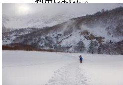
結氷した銅沼を渡ります。