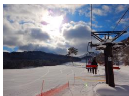
裏磐梯スキー場のリフトを利用しました。