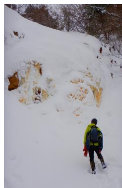
冠雪したイエローフォール