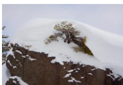
岩の上の松の仲間