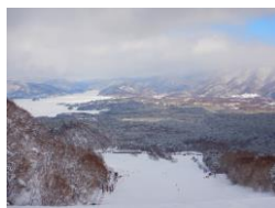
ゲレンデ上部からの景色