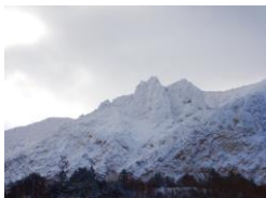
天狗岩が望めました。