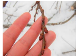
イヌコリヤナギの冬芽