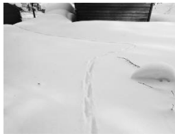
ホンドギツネの足跡