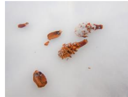
ニホンリスの食痕