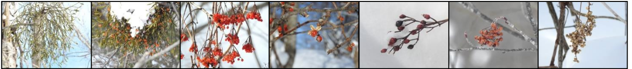
ヤドリギ(実) アカミヤドリギ(実) カンボク(実) ツルウメモドキ(実) ノイバラ(実) ナナカマド(実) ツタウルシ(実)