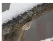
ウスバフユシヤク