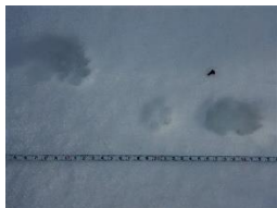
ホンドタヌキ (猫の可能性もあり)