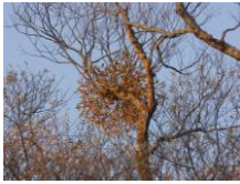
ヤドリギ(オレンジ色の実)