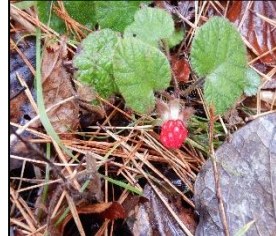
マルバフユイチゴ