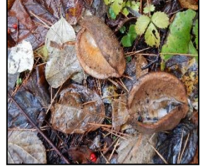
ミツバアケビの実